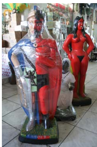
Fig. 1 – Ogun Xorokê, Preta-Velha e Maria Padilha (Mercado de São Joaquim, Salvador 2007).

Não quer isto dizer que deixe de fazer sentido pensar em bem e mal, em desejo e medo, em socialmente frutífero e socialmente destrutivo – ou mesmo numa figura que personifique os perigos da vida. Deixa somente de fazer sentido ter uma figura (de alguma forma divina – ou, pelo menos, espiritual) que pontue a fé monoteísta, contrapondo à compaixão divina a sua absoluta e irredimível maldade. As essências interpenetram-se, como nessa imagem de Ogun Xorokê (meio Exu/Diabo, meio Ogun/Santo António Sargento) 14 , tão perturbantemente dupla, esperando comprador numa loja do Mercado de São Joaquim em Salvador: