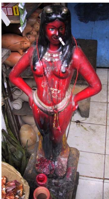
Figura 3. Pomba-Gira, Mercado de São Joaquim, Salvador, 2005.

Tantas vezes o demónio brasileiro tem uma garrafa na mão, um cigarro na boca e manifesta-se sob forma de uma linda e vermelhíssima mulher que procura o deleite sexual (cf. Fig. 3) : “Figura mítica do mundo invertido, a Pomba-Gira não só atende e pode permitir exprimir os amores fora da divisão costumeira dos sexos, como ainda deve seduzir tanto homens como mulheres pela sua atuação amorosa fora da domesticidade das normas” – e, aí, Marlyse Meyer prossegue no seu oracular ensaio itemizando os amores de Riobaldo (o “pactário” prototípico) para o deleite de quem guarda na memória as páginas de Guimarães Rosa: Diadorim/Diadorina, Otacília, Rosa’uarda, Maria da Luz e Hortência, as prostitutas lésbicas e, finalmente, “Aquela linda moça, meretriz, vestida de vermelho, por lindo nome Nhorinhá ...” – inesquecível! 27