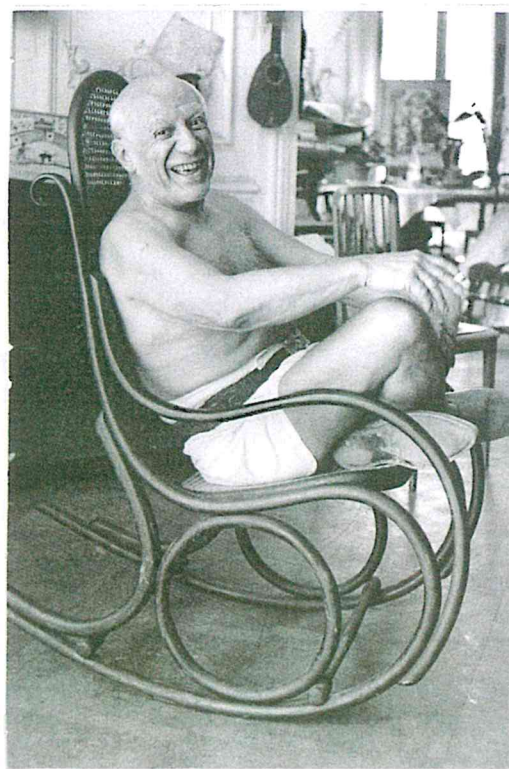
Couverture et 4 e de couverture : © David Douglas Duncan 2014